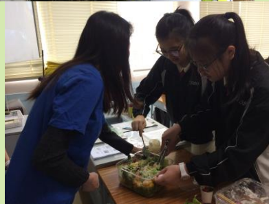
同學們嘗試製作蔬菜沙律。

我們亦提供整作的方法，鼓勵他們食用自己親手栽培的農作物，既能感受收成的喜悅，又能享用有機的健康蔬菜。