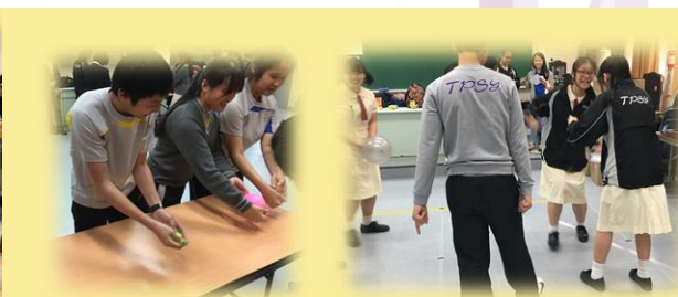
同學們玩挑戰一分鐘遊戲及「移動迷宮」。