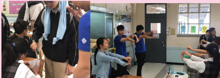
同學們在體驗網絡成癮的嚴重性及進行簡單伸展動作。