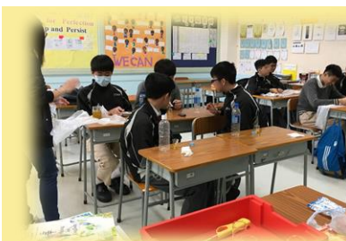
同學們在製作橙油潤唇膏。